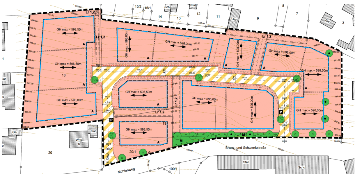
Abb.: Planteil des rechtsgültigen Bebauungsplans, Geltungsbereich der Planänderung

Die Gesamtfläche des Geltungsbereiches beträgt ca. 1,1 ha.