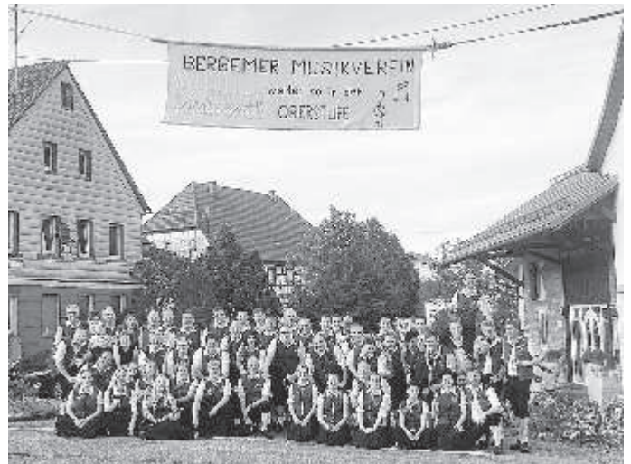
Die Musikerinnen und Musiker des Bergemer Musikvereins