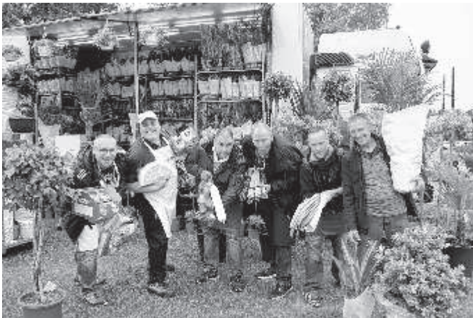
Die Marktschreier kommen wieder nach Ehingen.

Also – auf und schnappen Sie zu! Info-Telefon 0173 2154891.hb