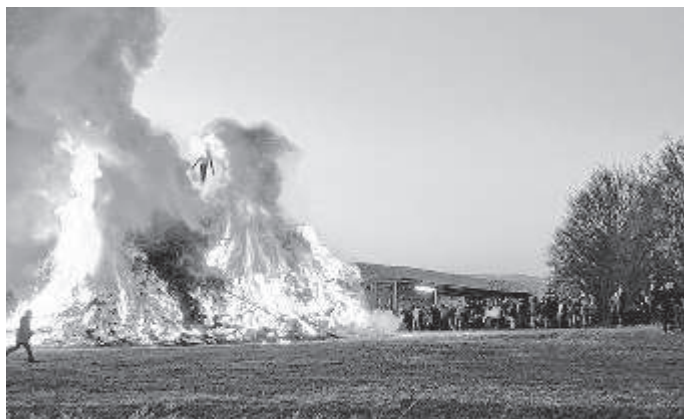
Abbrennen des Funkenfeuer oberhalb der Einfahrt nach Hausen ob Allmendingen

Auf Ihr Kommen freut sich die Feuerwehr Allmendingen.